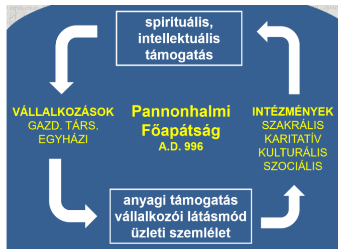
1. ábra: A Pannonhalmi Főapátság tevékenységeinek összefüggései

Ezen tevékenységek között zajlik a Főapátság szerzeteseinek élete a jelenlegi Főapát 2014-es előadása szerint. A vállalkozások eredményéből, költségvetési forrásokból, pályázatokból és adományokból biztosítják az anyagi feltételeket a Főapátság működéséhez, a nonprofit missziós tevékenységekhez (szociális, oktatási, szakrális, kulturális, karitatív), ahogy azt az 1. ábra bemutatja. A spirituális háttér pedig stabil értékek mentén meghatározott alapot szolgáltat az intézmények, vállalatok szervezeti kultúrájához, mindennapi működéséhez. (Hortobágyi, 2014).