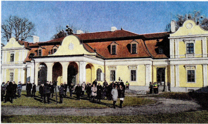
Tuzsér megmentette az utókornak a Lónyay család kastélyát