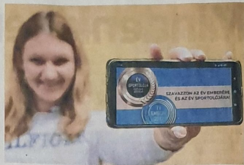
A szavazás február 14-én 10 óráig tart

Az év férfi csapata: Kisvárdai Master Good (labdarúgás), Hübner Nyíregyháza BS (kosárlabda), A' Stúdió Futsal