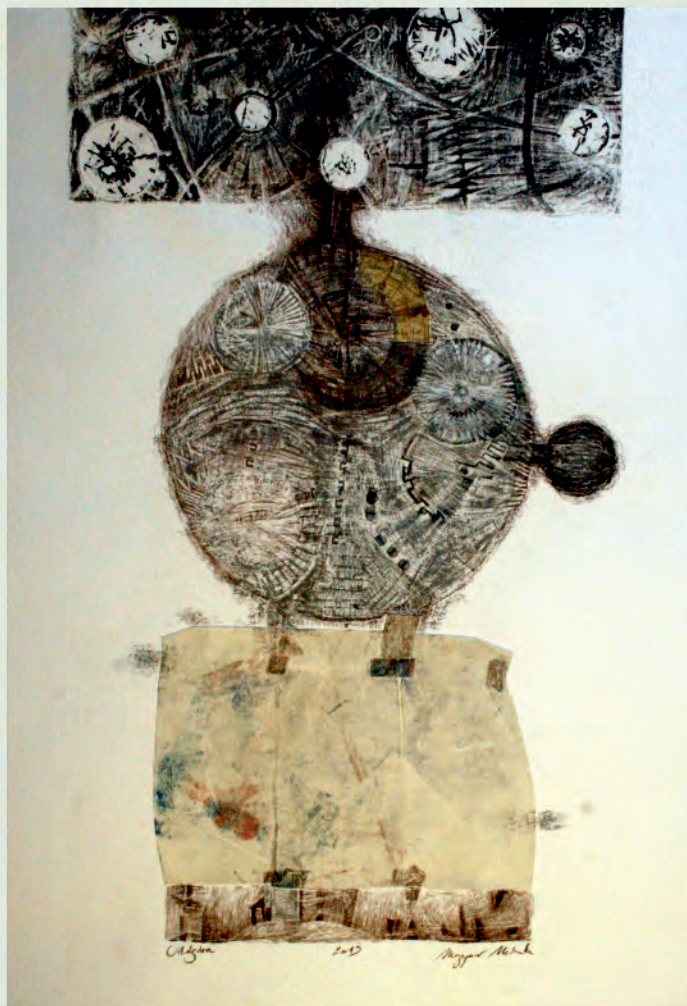
MAGYAR MÓNICA: VILÁGÓRA